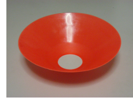
図 4: コーン (下向き)