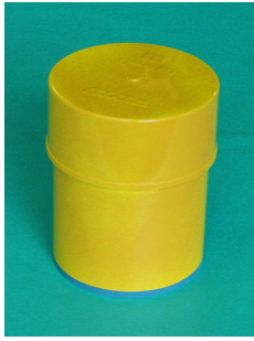
図 2: 障害物