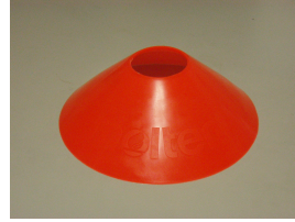
図 3: コーン (上向き)