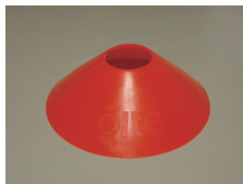
図 3: コーン（上向き）