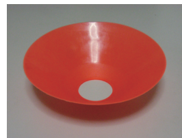
図 4: コーン（下向き）