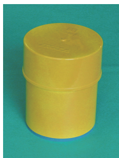
図 2: 障害物

【反則行為】 救助以外にも、ロボットが障害物をおしてかなりの距離押して移動した場合は、相応のペナルティを与えます。